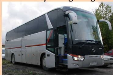
Автобус King Long