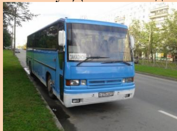
Автобус ДАФ 1996 год